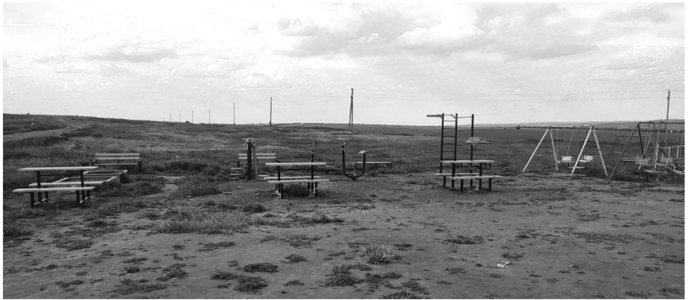
Примэрия рассмотрит зарегистрированные обращения и сообщит о принятых решениях

Мы, члены инициативной группы CONGAZ PUNE UMĂRUL, совместно с примэрией села Конгаз, договорились организовать консультации с жителями перед составлением и утверждением местного бюджета.