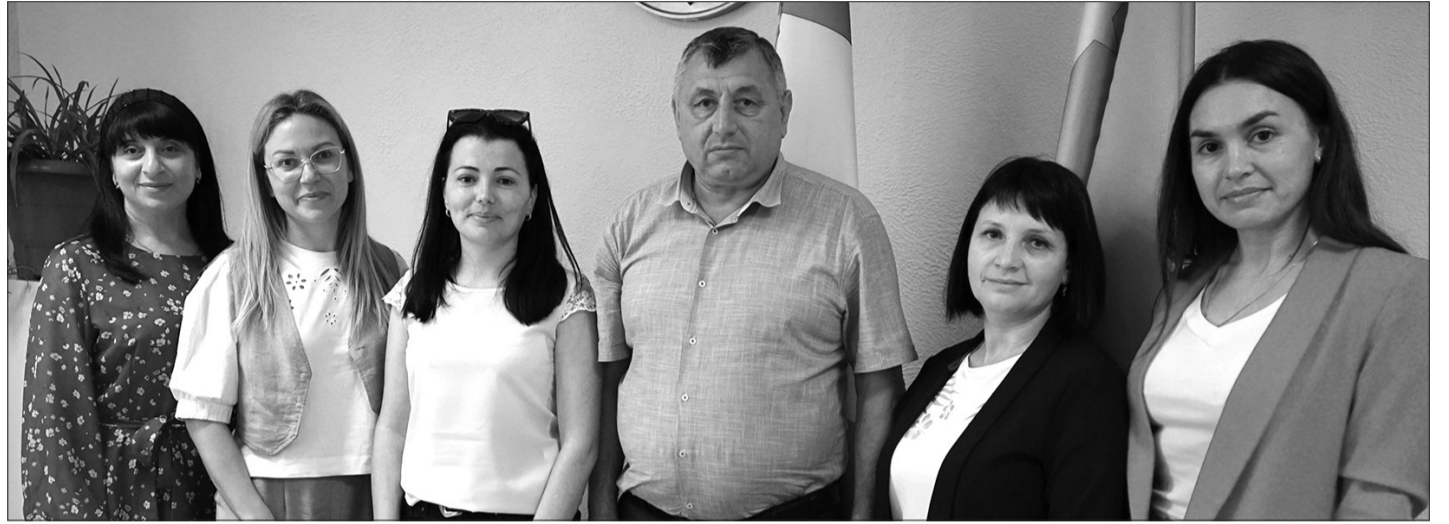
Примэрия Конгаз создает лучшую практику по выявлению проблем, существующих в нашем селе

Инициативная группа CONGAZ PUNE UMĂRUL совместно с примэрией с. Конгаз предлагает жителям села обсудить в сообществе реальные возможности местного бюджета и то, как граждане могут принимать совместные решения о расходовании денег нашего населенного пункта.